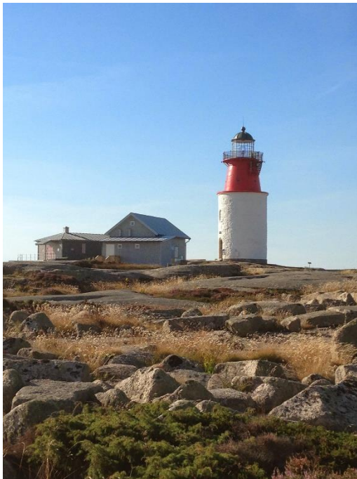
Hällö Fyr.

Hällö ligger ca en halv sjömil söder om Smögen. Ön är en av de större i Sotenässets ytterskärgård. Med sina ca 70 ha dominerar den södra horisontlinjen sedd från Kungshamn och Smögen. På öns högsta punkt lyser Hällö fyr (39 möh). Berggrunden på Hällö utgörs av bohusgranit. Den är formad och slipad av inlandsisen, och det är lätt att gå till fots. Mer påtagliga bevis av inlandsisens formskapande verksamhet på berggrunden finns på flera ställen i form av skärtråg, rännor, hållkar och jättegrytor. Här och var täcker gräs, ljung och kråkris granitlandskapet. Vegetationen är i hög grad representativ för öarna i det yttersta havsbandet. Mitt på ön, strax väster om de gamla fyrvaktarbostäderna, finns en igenvuxen våtmark. I närliggande buskar av