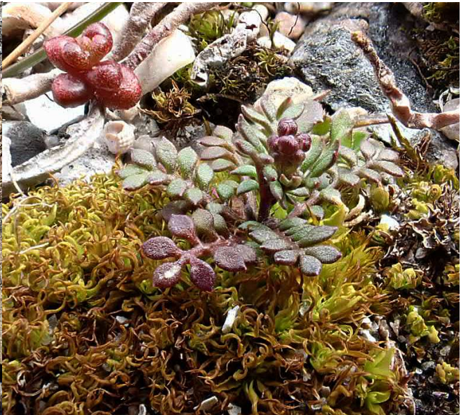
Strandmalörten och den mycket lilla stenkrassingen