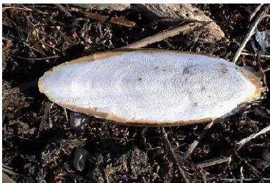
nytt uppspolat bläckfiskskal på stranden