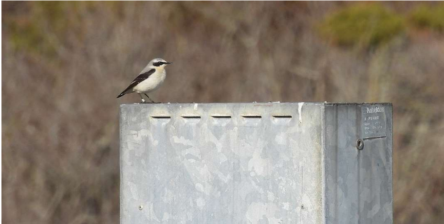
Hane vid elskåpet

Den 13 april fanns stenskvätteparet vid cementplattan och elcentralen på plats, både hane och hona med metallring men inga färgringar.