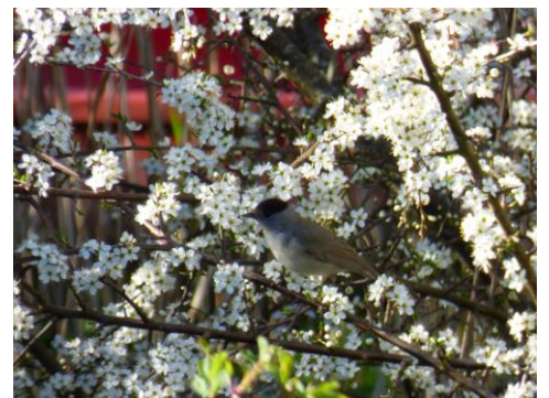
Svarthätta: Foto: Peder Kinberg

I dalgångarnas buskvegetation häckar Näktergal och Kärrsångare. I den uppvuxna lite sumpiga lövskogen ses Mindre hackspett, Gransångare, Härmsångare och Svarthätta. Enkelbeckasin, Ängspiplärka och Gräsiska finns på kringliggande berg.