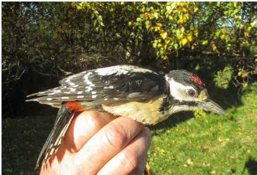
Större hackspett.

Anneröds bokskog ligger några kilometer från Bottnafjorden. De fågelarter man finner i området är typiska för kustnära ädellövskog. Det finns gott om träd med bohål åt mesar och flugsnappare. Lågor och torrakor är habitat åt Större och Mindre hackspett som bänder efter föda i de murkna träden. Spillkråkan trivs och Skogsduvan tar ofta över bohålen i de grova bokarna. Stenknäckens torra läten hörs året