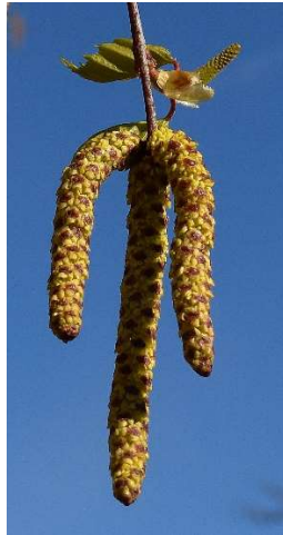
Vårtbjörk med hängande hanblommor och honblommor upp till höger.