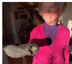
Så ser skorna ut efter säsongen