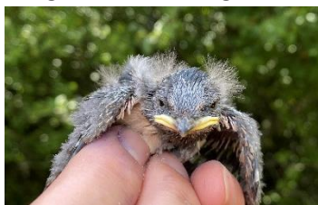
Dom är söta de små svalungarna

I övrigt om du har frågor så ring vem som helst i styrelsen; tel och e-post på grosshamn.se